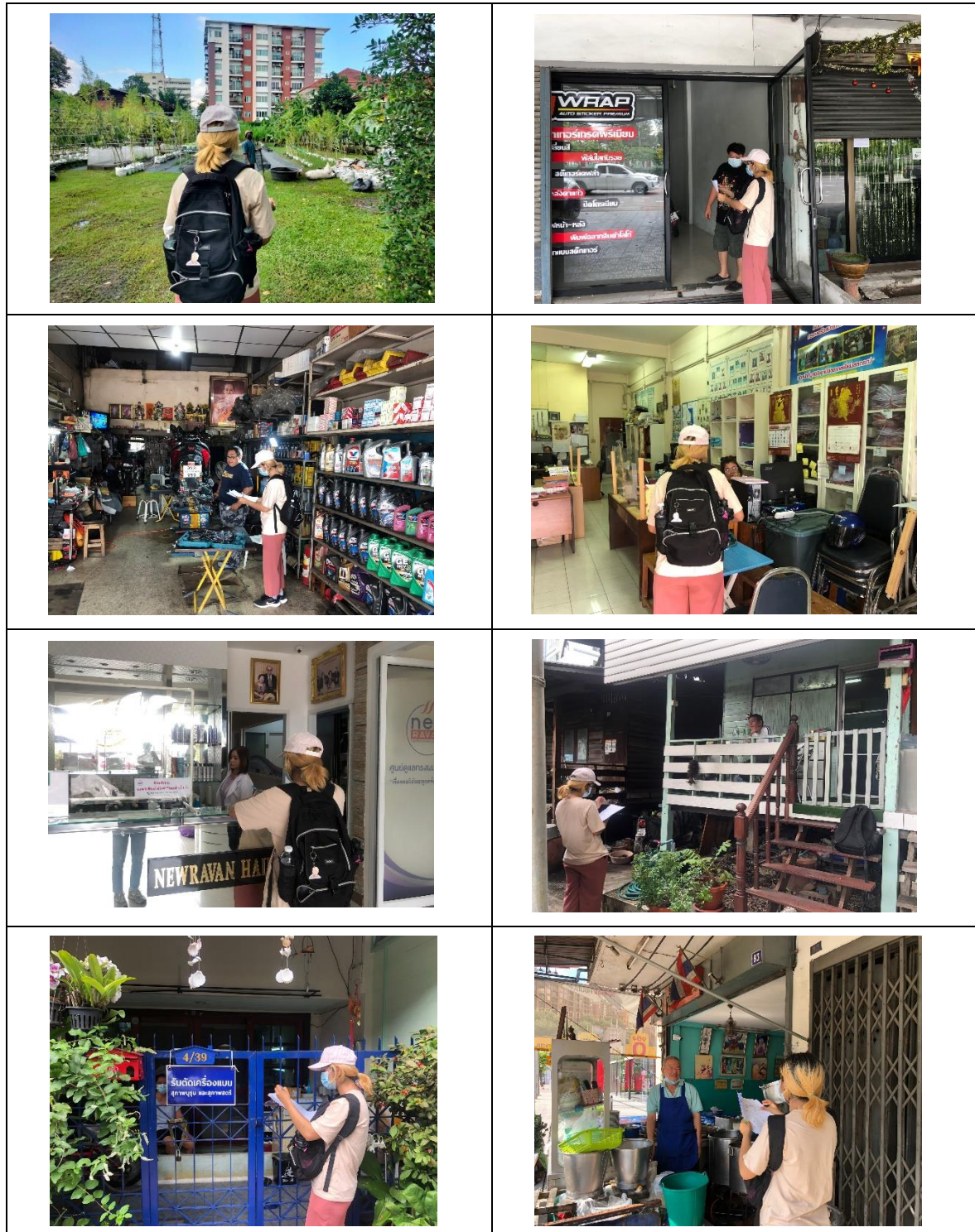
รูปที่ 4 การสำรวจสภาพเศรษฐกิจ สังคม และความคิดเห็นของประชาชน และหน่วยงานที่เกี่ยวข้อง