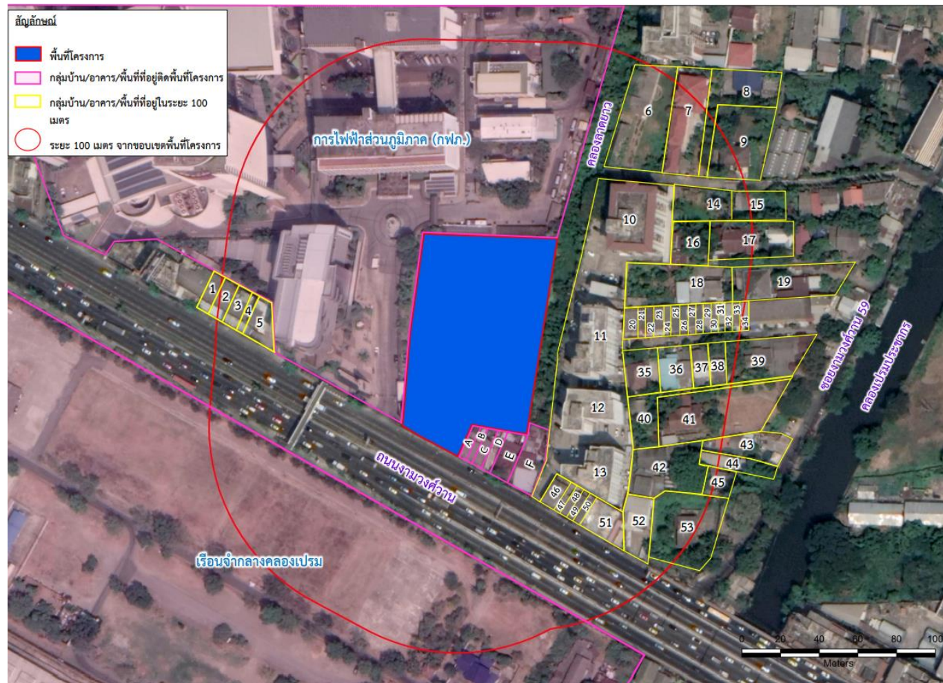
รูปที่ 2 ผังการสำรวจความเห็นบ้าน/อาคารในระยะ 100 เมตร จากขอบเขตพื้นที่โครงการ