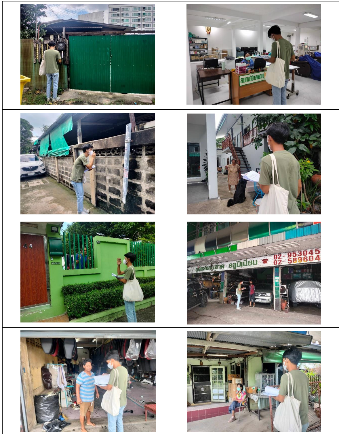
รูปที่ 4 การสำรวจสภาพเศรษฐกิจ สังคม และความคิดเห็นของประชาชน และหน่วยงานที่เกี่ยวข้อง